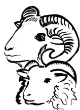
Föreningen Ålandsfåret r.f.

Sista anmälnings- /betalningsdag: 18 dec 2009 . Bindande.