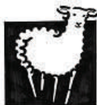
Ålands Fåravälsförening r.f.